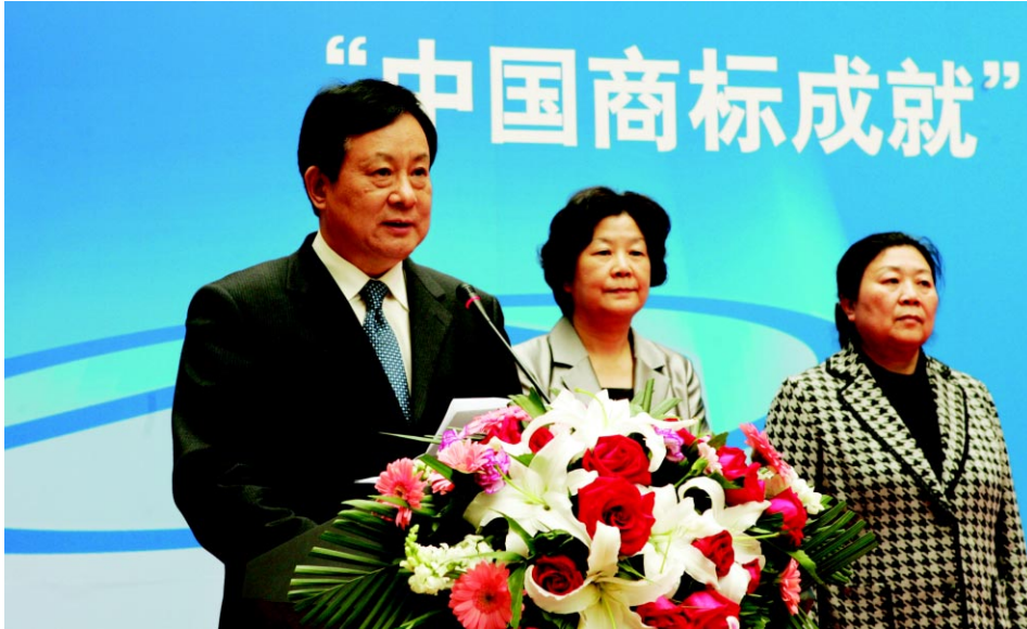
国家工商行政管理总局党组成员、副局长 付双建致辞