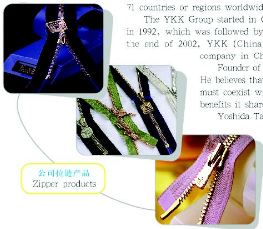
公司拉链产品 Zipper products

At present, everyone at the YKK Group accepts this idea as the fundamental philosophy of their business and will remain loyal to this concept as YKK develops.