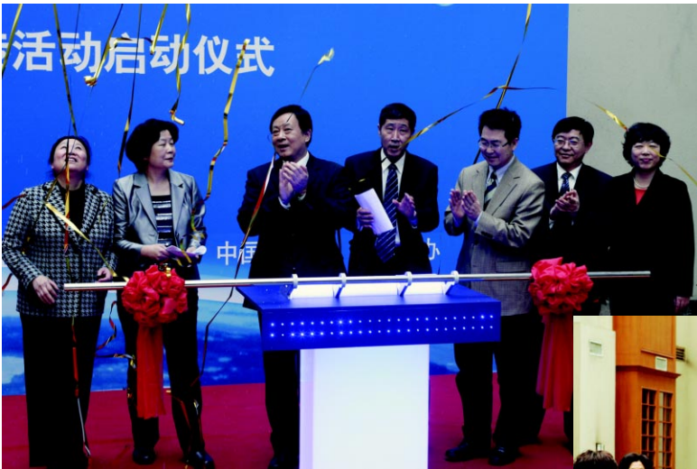
◀ “中国商标成就”宣传报道活动启动仪式现场