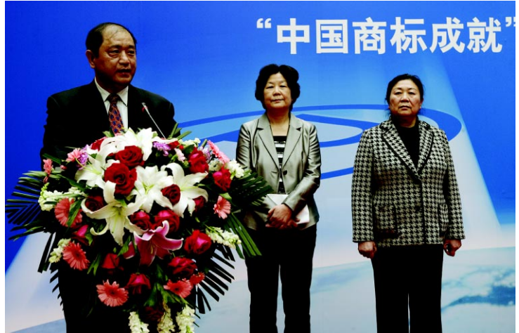
国家工商总局商标局李建昌局长主持开幕式