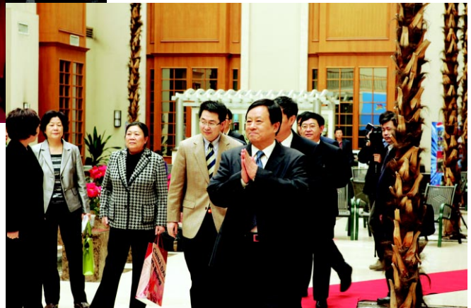
国家工商行政管理总局副局长付双建走进启动仪式现场 ▶

2010年4月26日下午，由国家工商行政管理总局与中国日报社共同举办的“中国商标成就”宣传报道活动启动仪式在京举行。国家工商行政管理总局党组成员、副局长付双建出席启动仪式并致辞，中国日报社副总编辑王西民出席启动仪式并致辞，中国日报社副总编辑曲莹璞，总局商标局局长李建昌，总局商标评审委员会巡视员侯丽叶，中华商标协会秘书长刘燕，江苏省工商行政管理局局长余义和，北京华旗资讯数码科技有限公司副总裁祁燕等8位领导和嘉宾共同启动了“中国商标成就”宣传报道活动。商标局副局长赵刚、吕志华，副巡视员郭连连，江苏省工商局副局长贺寿天，以及商标局的25个处（部）的处长、中国日报社相关部门负责同志，北京市工商局、江苏省工商局相关部门的负责同志出席了启动仪式，新华社、《经济日报》、《法制日报》、《中国青年报》、人民网、搜狐网、新浪网等新闻媒体记者出席启动仪式。启动仪式由国家工商总局商标局李建昌局长主持。以下是启动仪式的现场图文实录。