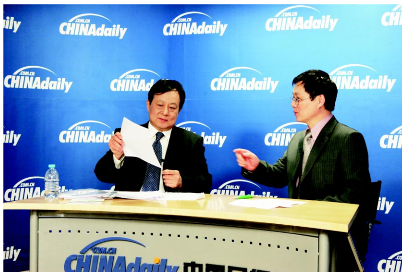
国家工商行政管理总局副局长付双建作客中国日报网

In 2008, the State Administration for Industry and Commerce made it top priority that backlog of trademark applications be solved, pending time reduced. Basically, we adopted three measures: