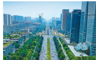
Le quartier financier de la ville est situé dans la zone de développement industriel high-tech de Chengdu.

Chengdu prévoit de devenir un centre financier de rayonnement mondial en 2022, au moment où la valeur ajoutée du secteur financier devrait atteindre 250 milliards de yuan (32 milliards d'euros), selon la municipalité.