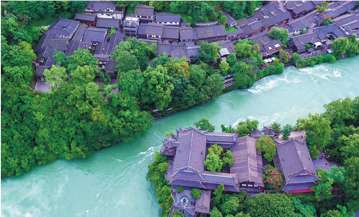
Vue aérienne du Dujiangyan, un ancien système d'irrigation et de conservation de l'eau à Chengdu. C'est là que commence le sentier vert de Jinjiang, qui fait partie du sentier vert de Tianfu.

Le panda Rong Rong vous sert de guide dans cette série de reportages sur Chengdu qui, dans ce numéro, met en lumière les efforts déployés pour faire de la ville une cité-jardin alliant beauté et respect de l'environnement. Le parc de la montagne de Longquan (Longquan Mountain Park) et le sentier vert de Tianfu (Tianfu Greenway) sont les deux principaux projets appelés à produire des retombées tant sociales qu'écologiques. Parallèlement, Chengdu vise à devenir un centre de création culturelle nationale ainsi qu'un pôle financier et industriel moderne, à l'image de la ville de renommée internationale misant sur le développement durable qu'elle veut incarner à l'horizon 2050.