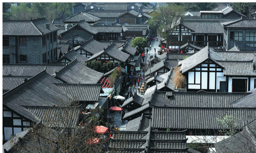
Les allées Large et Étroite, aux maisons dont le style remonte à la dynastie Qing (1644-1911), sont l'une des destinations les plus prisées des touristes à Chengdu.

Le parc comptera avant la fin de l'année environ 40 km de routes montagneuses et 200 km jalonnées de plateformes d'orientation. Autre programme majeur dans le projet de bâtir une cité-jardin : le sentier vert de Tianfu, dont la construction a commencé en 2017 et qui est dans les temps pour être achevé avant 2035. À l'issue des travaux, c'est une